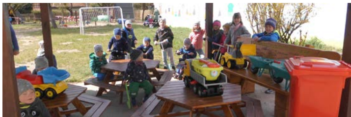
Die Moorgrundhüpfer haben für den Außenbereich neue Sitzmöbel und eine knallrote Tonne voller Spielsachen erhalten.

gen Spendern auf diesem Weg ein großes Danke senden. Sie haben den Kindern in der schwierigen Coronazeit, mit all den gegebenen Einschränkungen, eine große Freude bereitet.